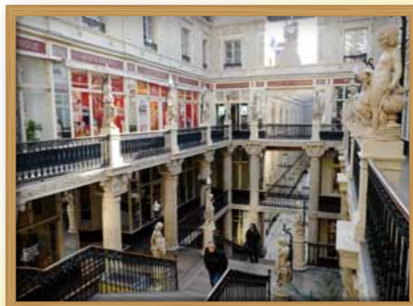
フランス最古の木造商店街「バサージュ・ボムレ」