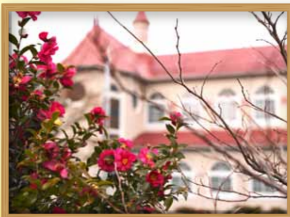
冬の新潟カトリック教会