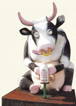
▲ 本社目印 マスコットの牛さん。 塚田社長の大学の先輩がデザインされたそうです。