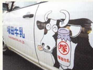
▲ 営業車にも牛さんがいます。